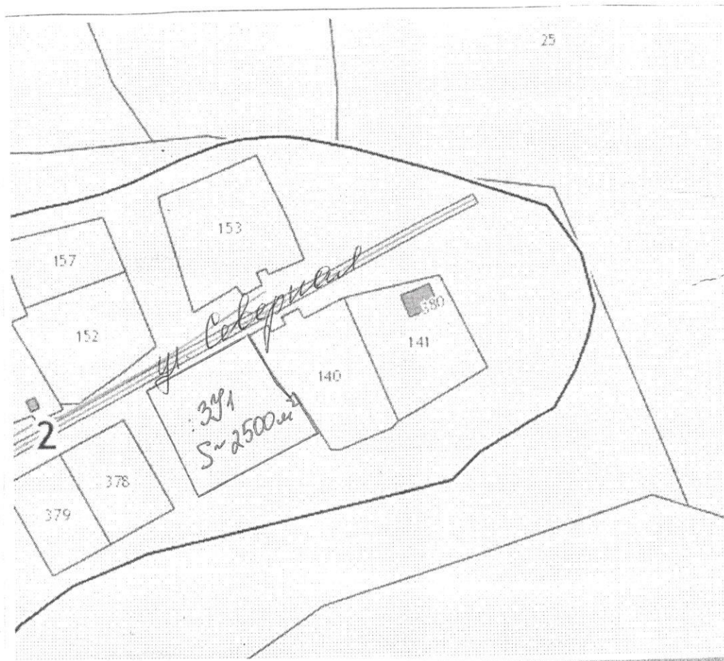
Схема размещения земельного участка с. Верхотор

Глава СИ Верхоторский сельсовет А.В. Турчин